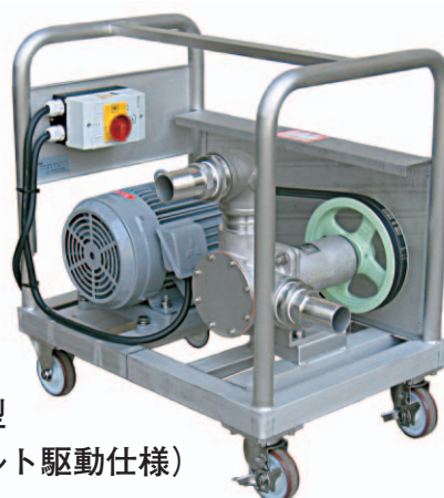
RSV型 (ベルト駆動仕様)